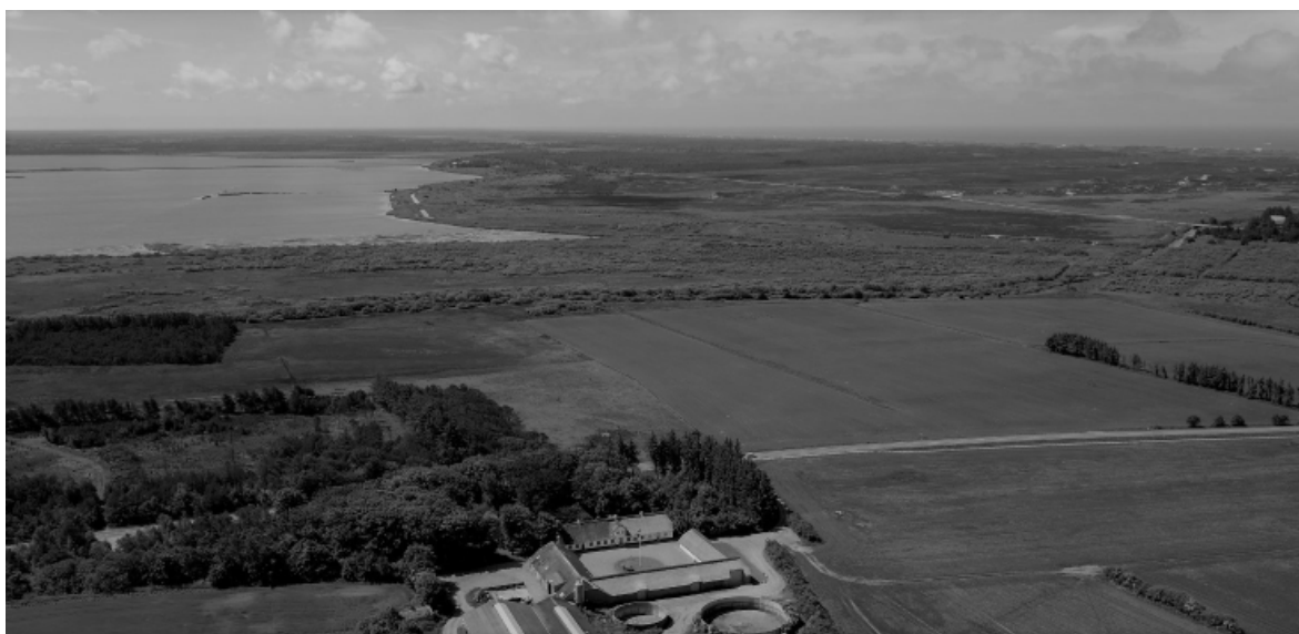
Billede 1. Børsmose bag Filsø øverst på billedet. Kjærgård plantage til højre på billedet. (2015)

Bag søen i sydvest ses den lille landsby "Børsmose" i Aal sogn, det vil sige, det er egentlig kun de tre højtliggende