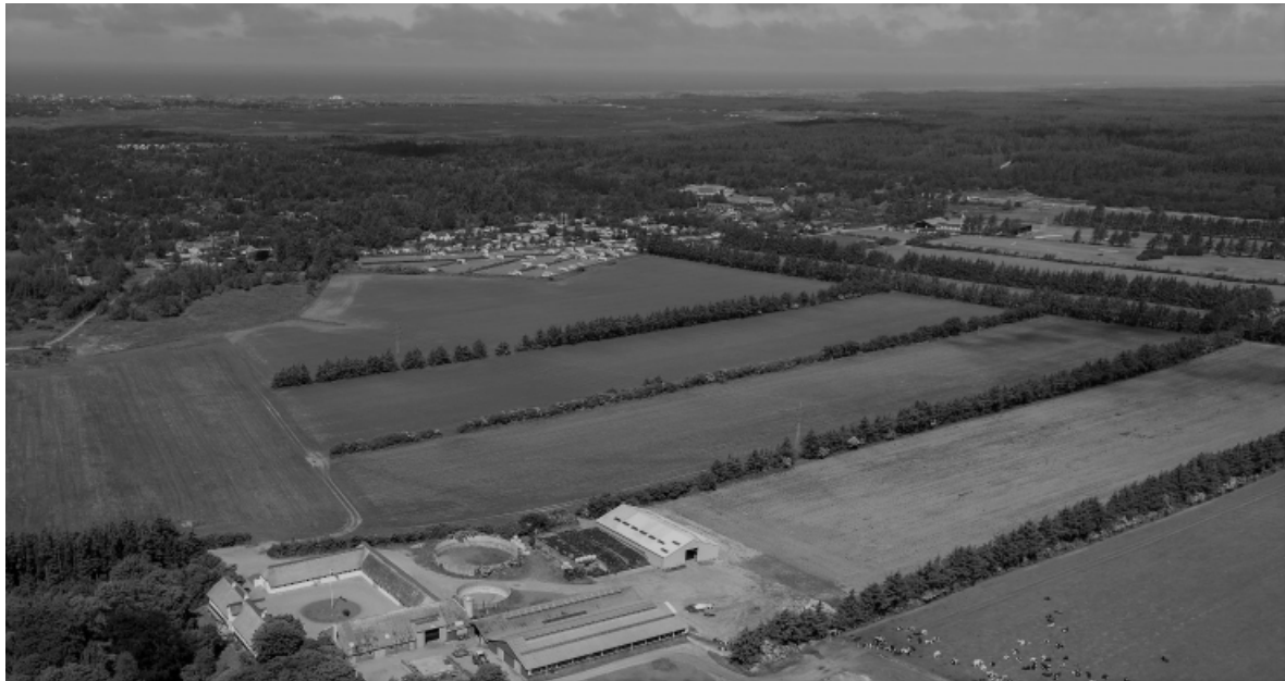
Billede 2.1 midten Henneby. Ud mod havet Henne Strand. Til højre på billedet Blåbjerg plantage.(2015)

Blåbjerg plantage strækker sig som et bredt bælte fra havet i vest, til helt over imod "Klinting" og afgrænser synskredsen mod nord. På arealerne mellem gården og plantagen i nord, ligger en række fredede gravhøje - minder om en svunden tids bosteder. Mod øst ses Henne stationsby; og i sydøst ud over Filsø - GammeItofts plantage og gård; vest for denne dukker "Filsø ø" op med sine få gårde.