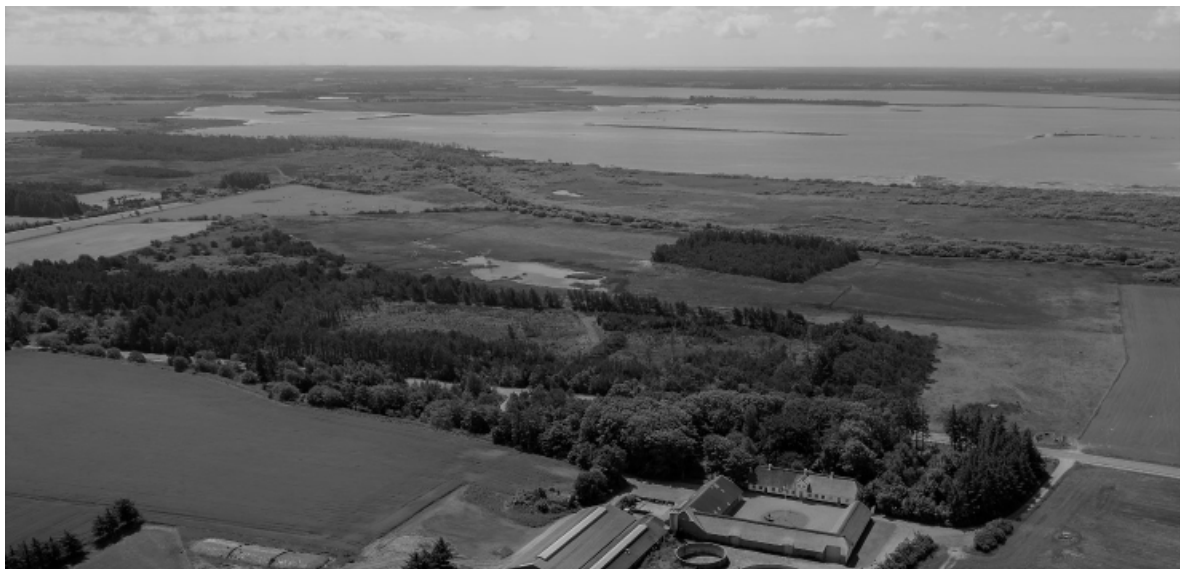
Billede 3.Hennegaard m. Filsø. Og filsø ø øverst til venstre(2015)

Alt, hvad der randes indenfor denne synskreds er historisk grund.